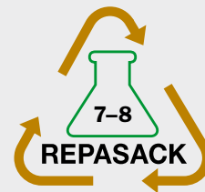
Füllgüter chemische Industrie Die Gruppen 7-8 (Ruß und Farbpigmente) können zusammen erfasst werden.