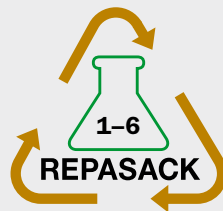
Füllgüter chemische Industrie Die Gruppen 1-6 (alles außer Ruß und Farbpigmenten) können zusammen erfasst werden.