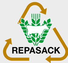
Füllgüter Nahrungsmittel- und Tierfutterindustrie