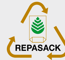
Wortbildzeichen ohne Füllgutbezug Keine eigene Verwertungsfraktion. Diese Säcke sind entsprechend den Inhaltsstoffen einer der links genannten Füllgutgruppen zuzuordnen.

Die oben genannten Füllgutgruppen müssen getrennt voneinander und entsprechend gekennzeichnet an den Annahmestellen abgegeben werden.